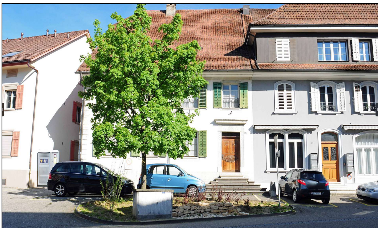
Abbildung 2.0-d: Trockenmauer Löwengasse