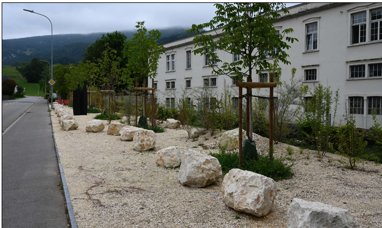
Abbildung 2.0-c: Entsiegelung und Ruderalfläche Baslerstrasse