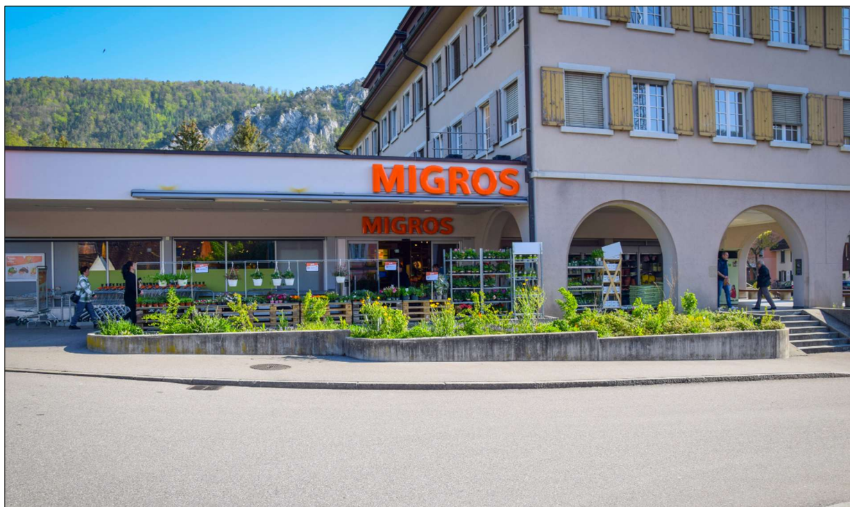
Abbildung 2.0-a: Neupflanzung mit einheimischen Arten beim Gemeindehaus